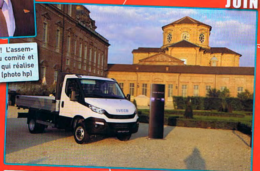
Le plus légendaire des Iveco, le Daily fait totalement peau neuve avec une très surprenante nouvelle face avant, des longueurs carrossables de 2510 à 6308 mm, des empattements de 3000 à 4750 mm et des ptac de 3,5 à 7 tonnes