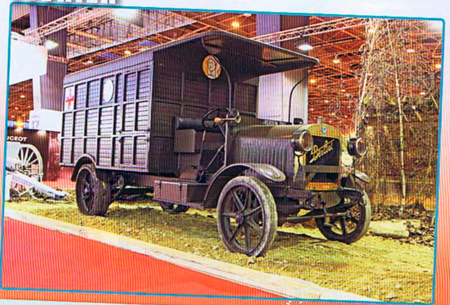
2014 commémore le Centenaire de la Grande Guerre. Le TL y participe avec une panoramique sur les camions de l'époque tel ce Berliet CBA de 1913 carrossé en ambulance. Qualifié «d'indestructible» il sera produit jusqu'en 1937