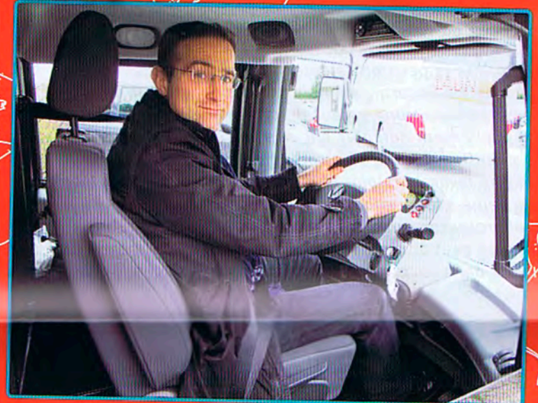
Les routiers, les chantiers sont omniprésents et tout le monde «oublie» les véhicules utilitaires légers, VUL. Sauf le TL qui s'agrandit en leur offrant une nouvelle rubrique D 2,8 à 12 T, Distribution de 2,8 à 12 tonnes. Du coup la rédaction s'enrichit d'un nouveau correspondant permanent en France Loïc Fieux