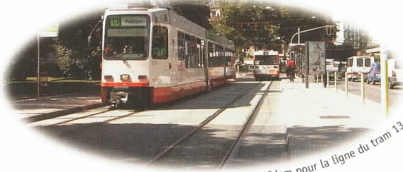
Idem pour la ligne du tram 13