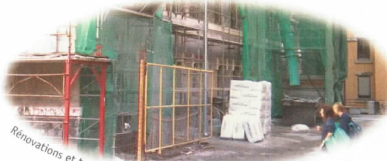
Rénovations et transformations de bâtiments