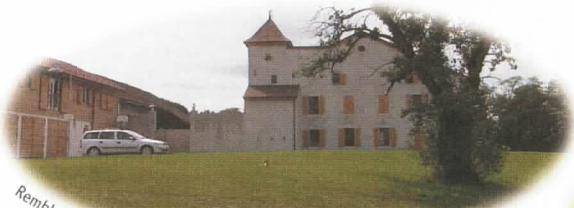
Remblayage des terrains avant engazonnement sur végétale PR, St-George