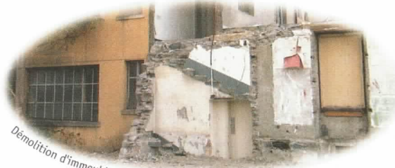
Démolition d'immeubles et d'installations en dur

L'ordonnance sur le traitement des déchets a rendu obligatoire le tri des déchets de chantier et leur valorisation.