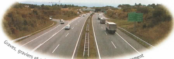
Graves, graviers et sables recyclés pour l'autoroute de contournement

Le gravier est un matériau non-renouvelable; son utilisation devrait être limitée aux seules applications ou un matériau recyclé ne peut être employé.