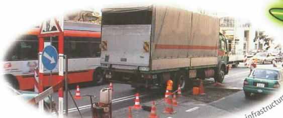
Routes en béton et enrobés bitumineux, anciennes infrastructures