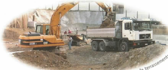
Moraines provenant de chantiers ou de terrassements