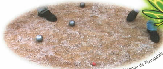
Fondations et surfaces de jeu, pétanque de Plainpalais